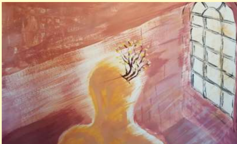
Cursus meditatief schilderen, 2019-2020