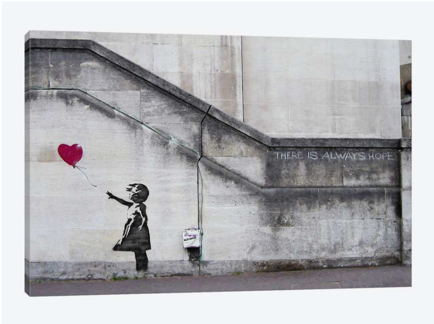
Banksy – Meisje met ballon